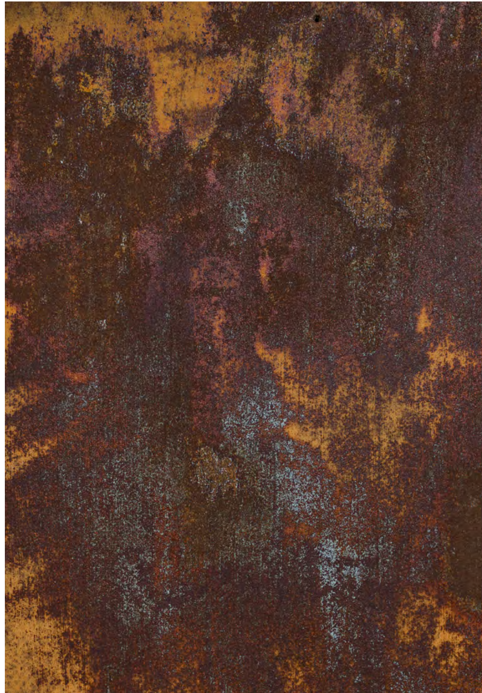
Teal + V (2 mani)