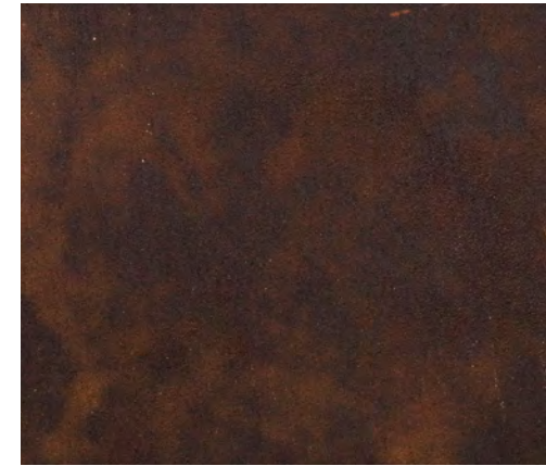
Dark + N (1 mani)