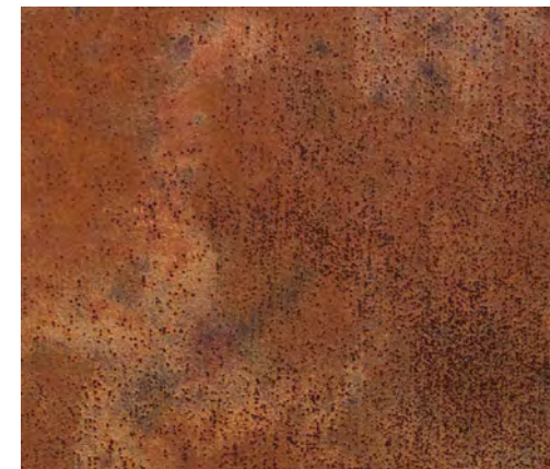
Dark + V (2 mani)