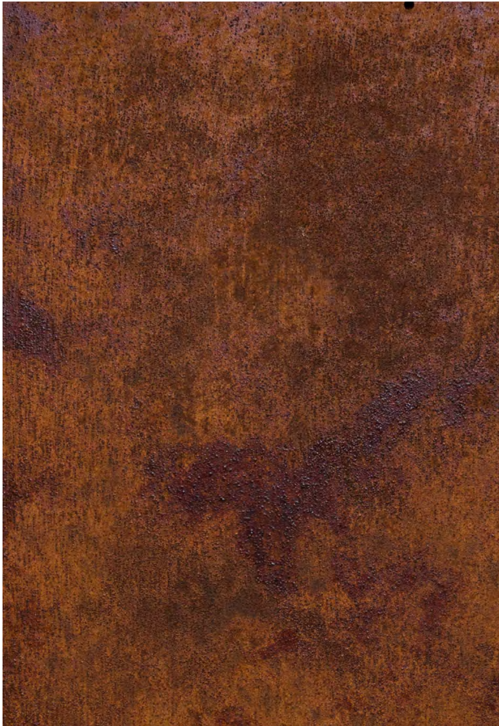
Dark + N (2 mani)