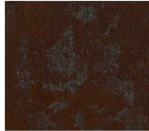
Teal + N (1 mano)