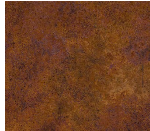
Teal + N (2 mani)